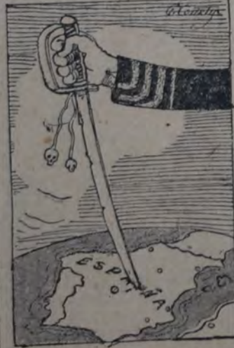
Triunfo el orden y el patriotismo en España

¿La constitución? ¿La democracia? ¿La misma disciplina, tan decantada por todos los vencedores del patriotismo?